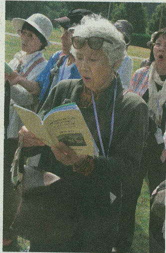
ČLENOVÉ japonské delegace společně u sousoší lidických dětí zapívali protijadernou hymnu Zachovejme modré nebe pro naše děti .